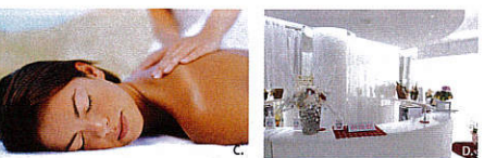
A. 加圧トレーニングではあなたに合わせた適正な圧力を加えてトレーニングを行います。B. 話題の痩身マシン「トリプルスistem」でボディメイク。C. エアモロジー他痩身機器、デトックスマッサージコースなども充実。D. 駅近のスタジオで使いやすいのもポイント! ジム感覚で通えるお得な月額コース ¥15,000 (税別) ~ まずは無料カウンセリングを!