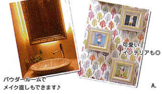
パウダールームでメイク直しもできます!

● http://www.goda-dental.jp/ 【ごうだ歯科医院 丹波市】で検案 兵庫県丹波市春日町平松713-1 アクセス/JR福知山線「黒井駅」より徒歩8分 診療時間/9:00~13:00 14:00~20:00 木曜・日曜・祝日休診 姉妹医院「たくや歯科」 http://www.takuya-dental.jp/ 阪神西宮駅すぐ