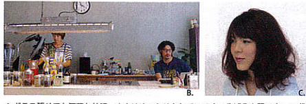
A. ガラス張りでお洒落な外観。店内はゆったりといてくつろげる空間です。B. 代官山でサロンを12年間してきた実力派スタイリスト。C. カット ¥4,500 (税別) 。