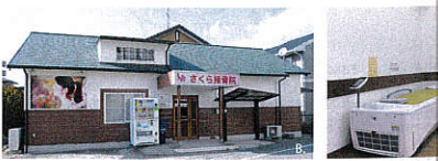
A. 専門知識が豊富な院長が親身になってカウンセリングいたします。B.C. 常時スタッフが在中してしますのでお気軽にご来院ください。初診料 ¥2,000 (税別)