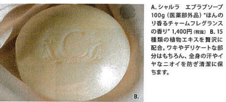
A. シャルラ エブラソープ 100g (医薬部外品)「ほんのり香るチャームフレグランスの香り」1,400円 (税別) B. 15種類の植物エキスを贅沢に配合。ワキやデリケートな部分はもちろん、全身の汗やイヤネなニオイを防ぎ清潔に保ちます。

ガーデン garden http://garden-beauty.co.jp/ 【Garden シャルラ】で検案